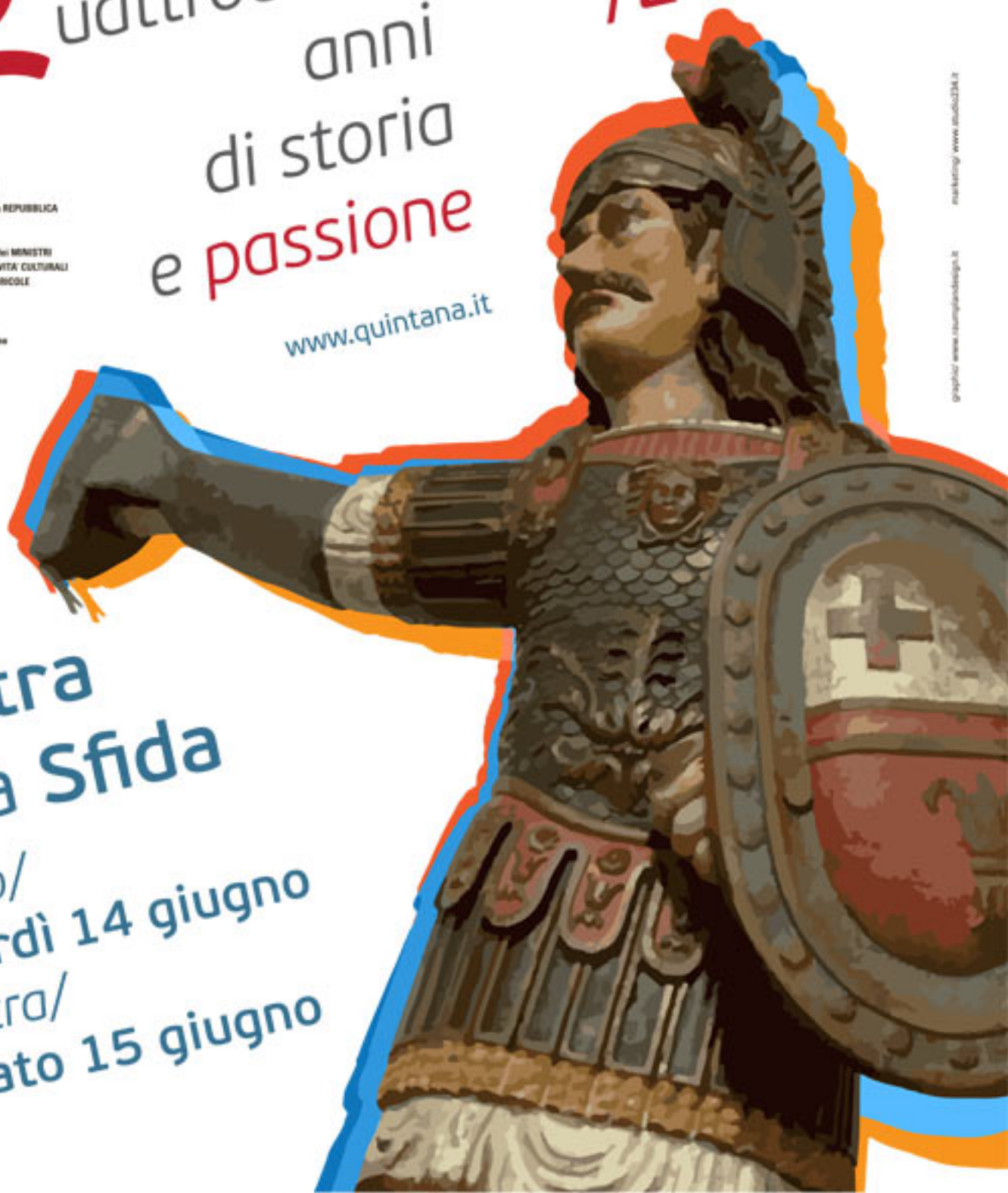
grafico: www.studio234.it marketing: www.studio234.it